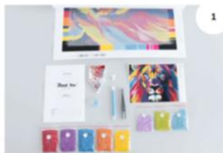
Przygotuj małe woreczki z diamentami, które znajdują się w Twoim zestawie do malowania diamentami.