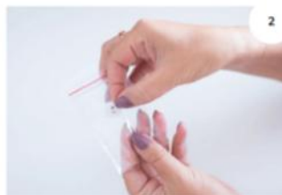
Na każdym woreczku z diamentami znajduje się symbol. W zestawie znajdują się również narzędzia wielokrotnego użytku i naklejki z symbolami.