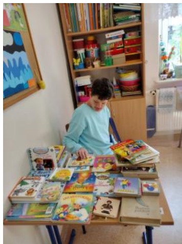
Światowy Dzień Książki

Spotkanie z książką w klasie 1ap. Kalendarz dni - świąt nietypowych w Klasie, w Grupie i w Ośrodku.